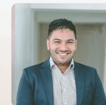
Leonardo Branco Imunidades tributárias: espécies e a jurisprudência do Supremo Tribunal Federal