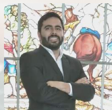
Alexandre Evaristo Pinto Lançamento tributário: conceitos fundamentais e questões controvertidas