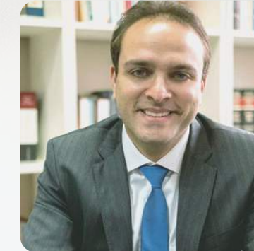
Paulo Victor Vieira da Rocha Princípios tributários: teorias e jurisprudência do Supremo Tribunal Federal