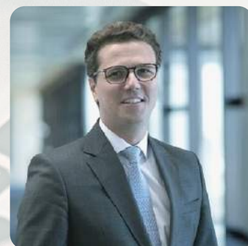
Ricardo Maitto O Sistema Tributário Brasileiro: visão crítica